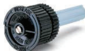
Bocais VAN pré-instalados